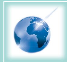
Das Feld des Friedens